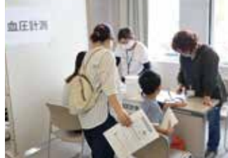
家族で健康チェック！

今年は5年ぶりの通常開催となり、当院、能美市立病院、寺井病院の市内3病院で健康チェックコーナーを出展しました。また、金沢大学と協働でバーチャルリアリティ体験「糖尿病クイズアドベンチャーゲーム」を行いました。来場者数は159名でコロナ前の8割程度でしたが、VR体験は定員27名を大幅に上回る35名を動員しました。