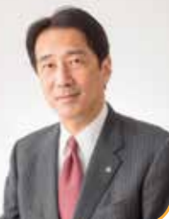
能美市 井出 敏朗 市長