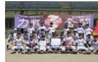
優勝：辰口学童野球クラブ

全7チームが参加し、熱戦が繰り広げられました。決勝戦では、辰口学童野球クラブが宮和学童野球クラブを抑え、7年ぶりの優勝を飾りました。