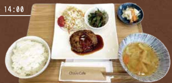
▲ハンバーグランチ