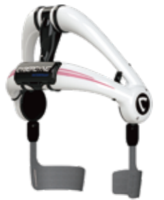
HAL 腰タイプ 介護自立支援用

人は身体を動かす際、「動かしたい」という意思に従って、脳から筋肉に信号が伝わります(生体電位信号)。HALは、装着者の皮膚に取り付けられたセンサーを通してこの微弱な生体電位信号を感知し、それを内蔵コンピューターが解析、装着者の動きを補助するようにスーツが動作します。HALには、腕や腰のみに装着するものから下肢全体をカバーするものまで、動作や目的に応じた様々なタイプがあります。